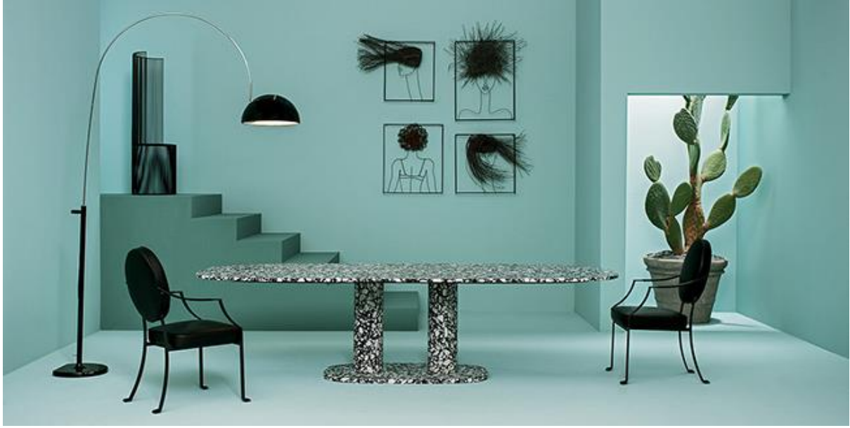
طاولة ماتيرا وكروسي غامبرينا، تقدمه 'ياكستر'