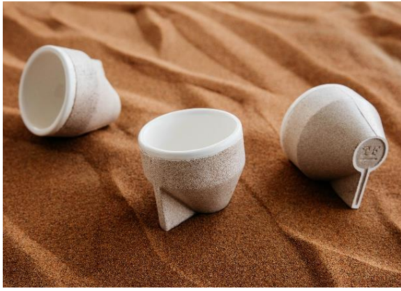
'ذي فاوندري' مجموعة رمل C01، يقدمه 'استوديو تنكه'

تقدم الفعالية أحدث الأعمال والمجموعات الفنية لعلامات تجارية تسجل أول حضور لها في المعرض، منها 'الشايح للمشاريع' و'أربز' و'أرتيميد' و'باكستر'، إلى جانب 'كابيلىني' و'كاسينا' و'ديزل ليفينغ' و'فراوتو' و'جانديا بلاسكو' و'ليلى أولوهانلي'، فضلاً عن 'مانفريدي ستايل' و'نورمان كوبنهاجن' و'بوفوركات' و'فيليريوي + بوش'.